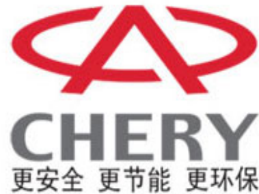
El logotipo de Chery

Según fuentes cercanas al Govern, la reunión se produjo a petición de la multinacional, aprovechando la presencia de los directivos de Chery en el Salón del Automóvil de Frankfurt (Alemania). Las mismas fuentes explicaron que ayer no se puso sobre la mesa ningún proyecto concreto, aunque el Govern aprovechó la visita para vender las ventajas de Catalunya para acoger alguna inversión logística o industrial en el sector de la automoción, entre ellas la presencia de Seat y Nissan y la existencia de un potente tejido de empresas de componentes. De esta forma, el Ejecutivo catalán quiere estar en primera línea en caso de que Chery se lance a invertir en el sur de Europa.