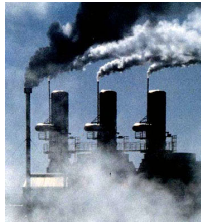
Empresas contaminantes en China

China está considerando cobrar un impuesto adicional a aquellas empresas que generen una gran cantidad de residuos contaminantes, con el fin de mejorar la protección del medio ambiente, informó el viceministro de Protección Ambiental de China. El funcionario del gobierno dijo que cobrar un "impuesto ambiental" a las empresas altamente contaminantes es una de las opciones que están siendo consideradas en el marco de la reforma del sistema tributario del país.